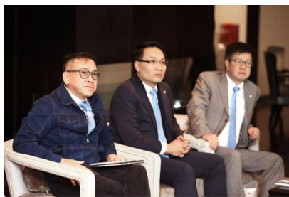
(嘉宾听取千叶品牌分享)

随后，香港珠宝制造业厂商会一行嘉宾听取了千叶品牌中心的分享会，纷纷赞许千叶近几年在品牌形象塑造、产品研发以及加盟、