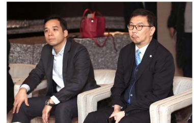
(嘉宾听取千叶品牌分享)

电子商务等新渠道的发展上取得的建树，众位业界专家一起沟通研讨未来珠宝行业发展新的机会点，而这些机会点在千叶，这样一个发展迅速的品牌身上，已经渐渐萌芽。对于未来开启全新的合作模式，香港珠宝制造业厂商会与千叶珠宝已然成竹在胸。