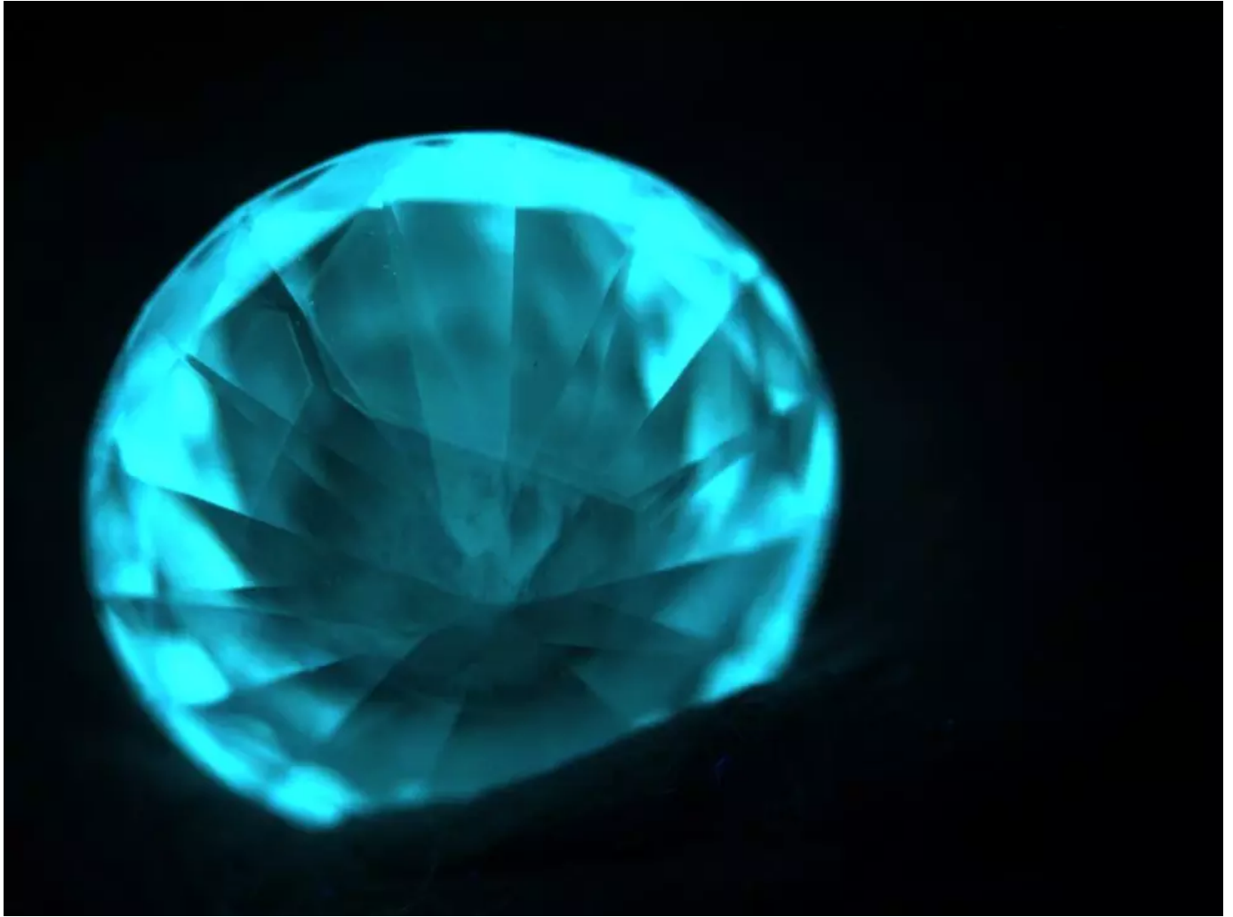
DiamondView™下觀測到HPHT合成鑽石典型熒光分區特徵

通過譜學測試得知該合成鑽石屬於IIb型鑽石，具有明顯的硼的吸收峰。經測試有導電性，並且具有一定的方向性。通過導電儀進一步檢測證明為IIb型。綜上測試，NGTC實驗室判定該樣品為IIb型HPHT合成鑽石。