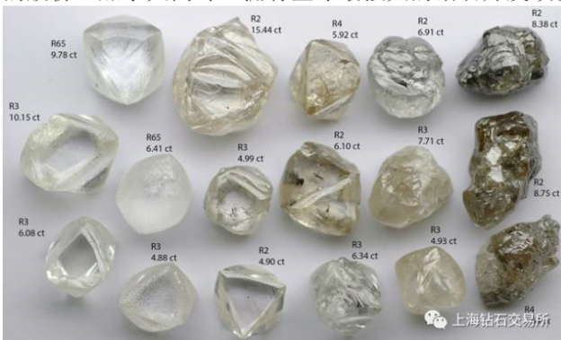
雷纳德钻石矿开采的钻石原石样品

加拿大目前可能是全球钻石开采最活跃的国家。该国拥有 5 座大型矿山以及最先进的基础设施，其中 2 座是最新发现的世界级钻石矿，卡邱古 (Gahcho Kué) 以及雷纳德 (Renard)，前者是戴比尔斯与 Mountain Province Diamond 的合资项目，后者属于 Stornoway 钻石公司。5 家业界巨头中的 3 家在加拿大拥有矿山资产，分别是戴比尔斯、力拓 (Rio Tinto) 以及多米宁钻石 (Dominion Diamond)。目前加拿大产值最高的矿区，戴维克 (Diavik) 钻石矿主要出产宝石级无色钻石，力拓持有该矿 60% 的股份，多米宁持有 40% 的股份。加拿大同时还拥有全球最强大的钻石开发项目运营通道。