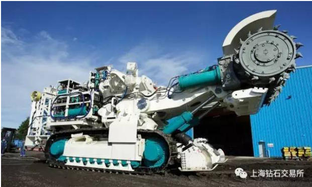
鸚鵡螺矿业公司的海底贵金属及贱金属开采设备

术，研发并非针对钻石，而是针对新几内亚海床上丰富的金、铜、银、锌等矿产的开发。该公司 4 月份起开始测试近期研发的海底开采工具。