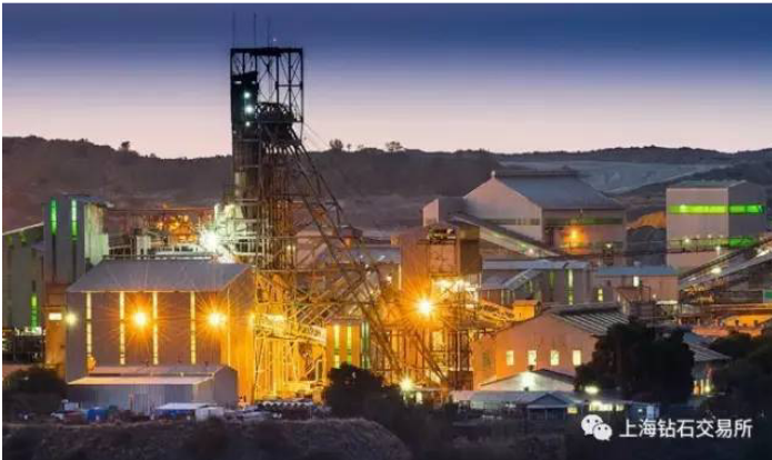
南非的库里南矿区

预计 2017 年南非的钻石产量超过 60% 都来自戴比尔斯的 Venetia 矿和佩特拉钻石（PetraDiamond）的 Finsch 矿。