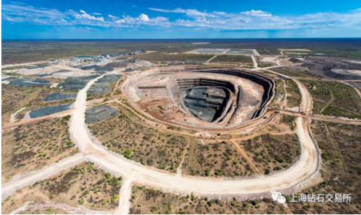
博茨瓦纳的 Karowe 矿

段。这个造价 220 万美元，工期 7 年的扩建计划将使朱瓦能的矿山年限延长至 2040 年。朱瓦能矿出产的钻石原石平均单价约为每克拉 200 美元，相比之下，ALROSA 最多产的 Jubilee 矿开采的原石为每克拉 150 美元，而全球矿山的平均价则只有每克拉 110 美元。奥拉帕钻石矿是全球面积最大的矿区，储量位居全球第 9 位，1971 年投产，目前开采深度已达 250 米。